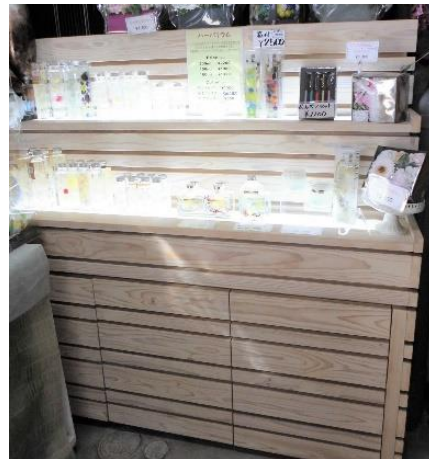
ハーバリウムを展示するための棚

花のイメージにある『日持ちしない、手入れが大変』を変えるべく『長期保存、手入れいらず』なハーバリウムを開発する。ハーバリウムとは、プリザードフラワーやドライフラワーを専用のオイルできれいに瓶づめたものであり、インテリアや贈り物に最適です。