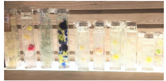
新商品 ハーバリウム