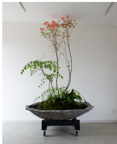
新商品 室内に飾る造園インテリア

日本古来の造園技術である石・苔・古木・コンクリートなどと植栽を組み合わせ、現代的な屋内空間のインテリアを創作し販売する。百貨店、アパレル店舗のギャラリー、イベント、ブライダル関係向けに販売する。