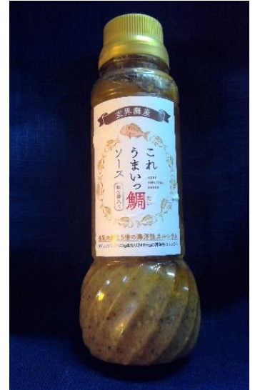
新商品 ドレッシング

鯛（身や骨）のペーストやオイルを抽出した鯛エキスなど、材料の配合を変えながら複数回試作を行いました。福ふくの里や自社の飲食店の来店客に試食してもらい、意見を取り入れながら商品開発できました。