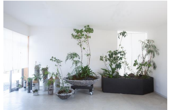
新商品 室内に飾る造園インテリア