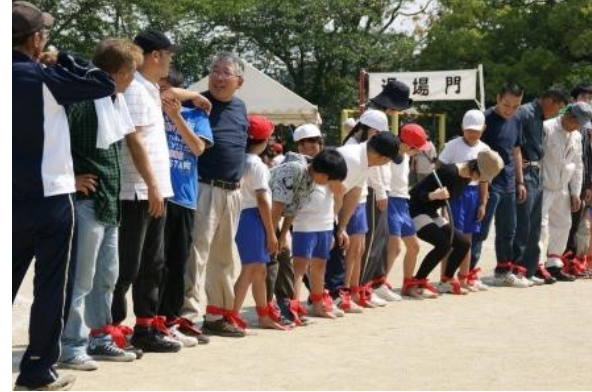
上/白糸の滝 下/地域合同運動会