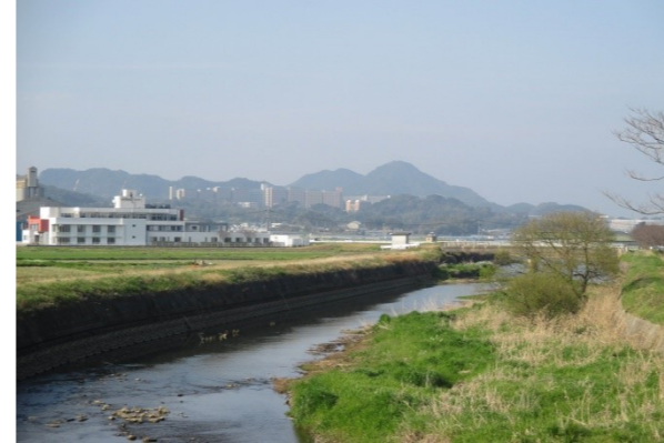
上 / 九州大学留学生との異文化交流餅つき 下 / 東風小近くから見える九州大学

雷山川沿いにある桜は、春になるとキレイですね。最近、東風小学校周辺の道が整備されて、広くなったり歩道と自転車道が分けられたりして安全になりました。行政区の行事は年2回の環境整備と運動会、バレー大会、隣組や行政区の総会くらいだから、あまり負担にも感じません。外食するのも、楽しみなお店も、いろいろあります。遠方にわざわざ連れて行かなくても、気軽に芥屋や幣の浜に海水浴に行けるし、夫は釣りに行って楽しんでいます。福岡市方面に近い場所で利便性は非常に良いと思います。