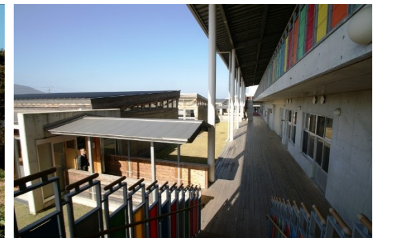
左 / 志登支石墓群 右 / 東風小学校