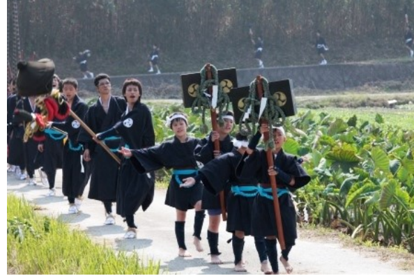
上/姉子の浜 下/福吉神幸祭