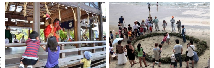
左/福井神楽 右/かずらの綱引き（子ども相撲）

福吉の日帰り入浴施設として地域に親しまれています。浴槽の種類も豊富で、日本庭園をイメージした露天風呂や檜風呂、家族でのんびりできる家族風呂などがあります。