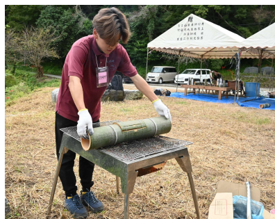
火山の竹は、灯籠・モルック・竹飯ごうに活用された

昨年9月27日、志摩稲留の火山薬師瑠璃光寺境内で火山竹灯籠祭り「竹火」が開催されました。この祭りは、九州大学の授業「合意形成論演習」の受講者の皆さんが実行委員会として参加。地元の竹林問題の解消と地域住民の交流の活性化のために、九大生が竹灯籠づくりのワークショップと竹モルック大会を企画。綿密な準備や協議を行い、祭りは大成功を収めました。