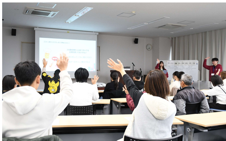
この日は大人も生徒！元気に挙手♪

昨年12月21日、糸島市の市民交流センターにて出張 九大寺子屋が初めて開催されました。