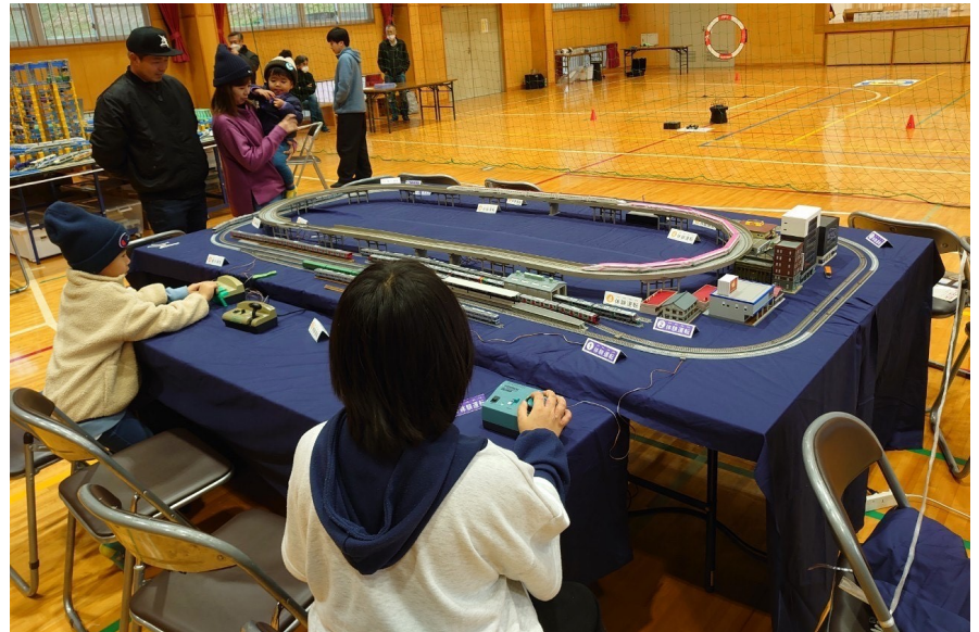
▲鉄道模型「Nゲージ*」の運転体験をする参加者 *レールの幅が9mmなので、英語の9（Nine）の頭文字をとって「N（エヌ）ゲージ」と呼ばれています。 縮尺1/150(新幹線車両は1/160)サイズ

鉄道研の活動は人を集め、地域を元気にしてくれます。今後も鉄道研のご協力の下、地域との連携・交流が広がることを期待しています。