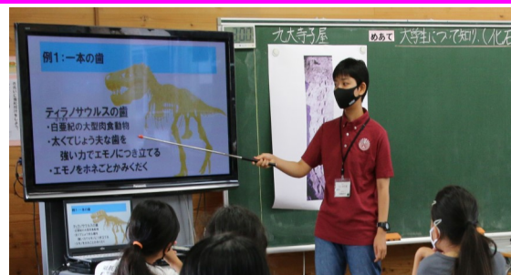
▲糸島市への寄附金を財源にして実施している「九大寺子屋事業」で市内小学5年生に化石の授業をする協力学生。