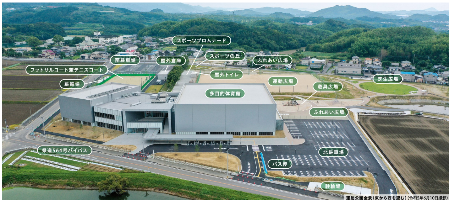
運動公園全景(東から西を望む)(令和5年6月10日撮影)

芝生公園や運動広場、多目的体育館にはアリーナ・トレーニング室などを備え、大規模災害時は避難施設としても活用できる、市民待望の「糸島市運動公園」。子ども、高齢者、障がいのある人もない人も、誰もがスポーツや憩いの場として利用できる施設です。ぜひご利用ください。