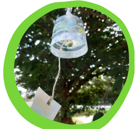
プラスチック リ 風鈴を作ろう!