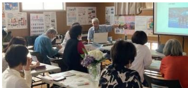
【こらぼ講座①スマホで写真の講座の様子】