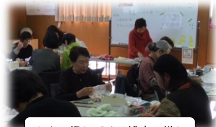
タオル帽子づくり講座の様子

この糸島には、ボランティアとしての活動の中から、生み出された凄い技能があります。活動者の思いを重ねて、その凄ワザを体験できたら最高ですね。