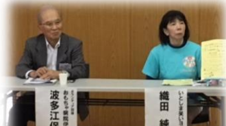
神ってる先輩方の深イイ話

今年で3回目の講座で、昨年は2の方に深イイ話をさせていただきました。身の温まる実のある内容でした。今回は、「続・深イイ話」を計画しています。みなさまも話を聞きたい講師がいらっしゃったら、リクエストをお願いします。