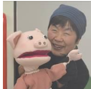
フェアの写真は「糸島半島写真クラブ」のみなさんが撮影してくださりました