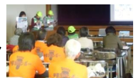
H27年度報告会のようす

平成28年度事業 公開プレゼンテーション ・5月10日(火) 10:00~ 糸島市人権センター3階大会議室