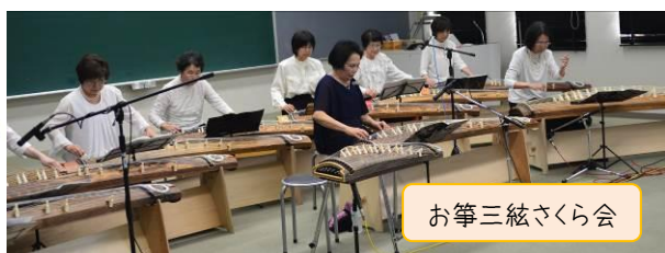
お箏三絳さくら会