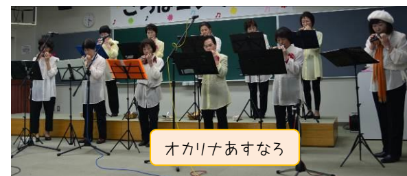
オカリナあすなろ