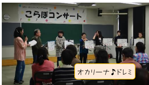
オカリーナ♪ドレミ

こらぼコンサートは、学校や福祉施設等でボランティア演奏活動をしている団体を市民のみなさんに知っていただくことを目的に開催しました。