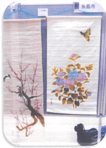
手描き染め教室「四季の華」