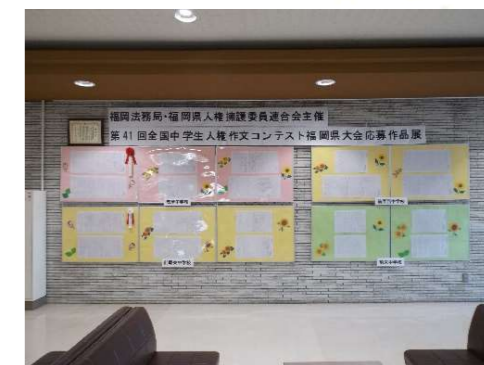
(昨年の人権作文展の様子)