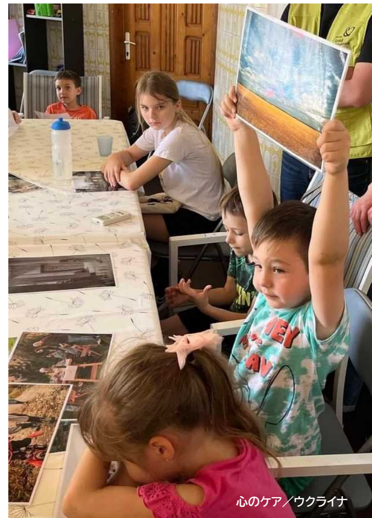
心のケア/ウクライナ