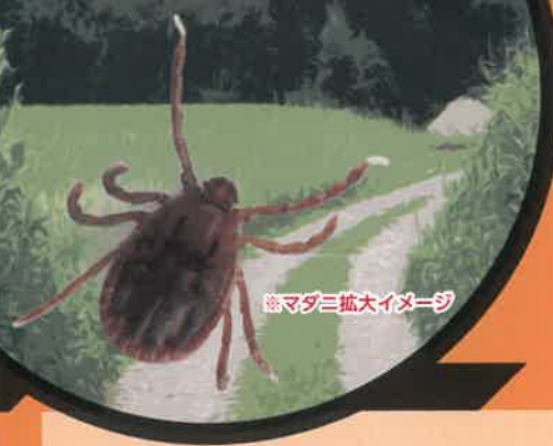
※マダニ拡大イメージ