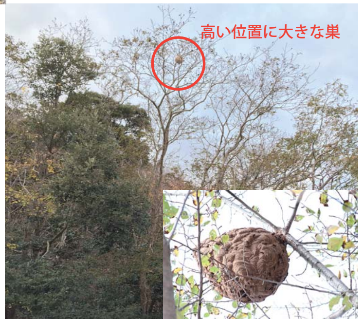
高い位置に大きな巣

環境省 自然環境局 野生生物課 外来生物対策室 〒100-8975 東京都千代田区霞が関 1-2-2 TEL:03-5521-8344 FAX:03-3504-2175