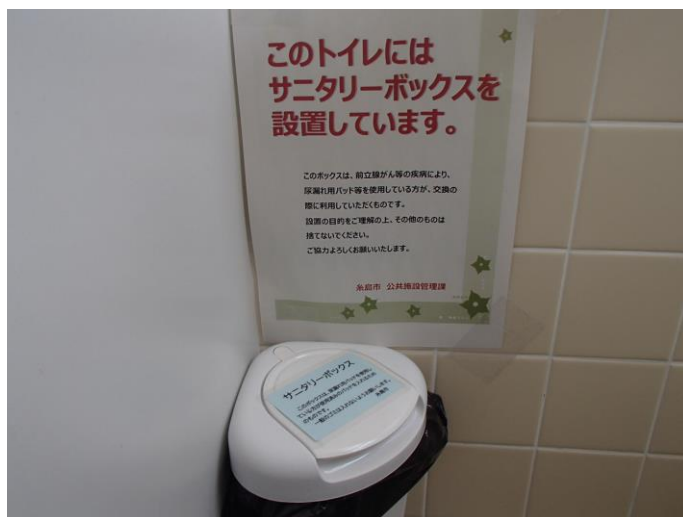
糸島市役所に設置したサニタリーボックス

今後、各校区のコミュニティセンター、図書館、文化会館、体育館など約60個を追加設置予定