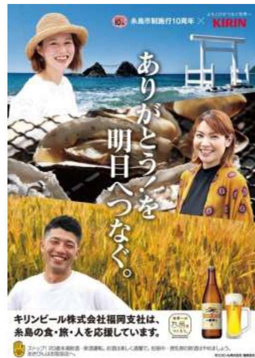
▲10周年記念オリジナルポスター