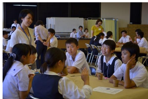
↑「高校生未来会議“いとしま”」のようす