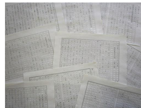
↑「中学生“いとしま”未来への提言」より