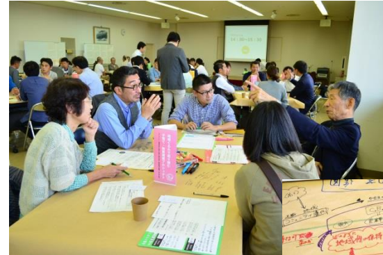
「まちづくり市民委員会」のようす↑