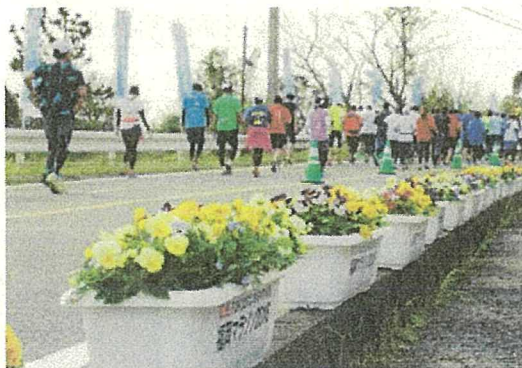
コース沿いにおかれたプランター。 ランナーをゴールへ導きます。

コース沿道やフィニッシュ会場等に、880鉢のプランターを設置したり、フィニッシュ会場周辺の花壇にコスモスの植栽をしたり、色とりどりの花で多くの人の目を楽しませます。