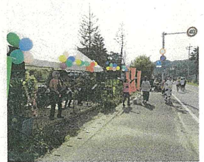
37km付近の応援風景。横断幕やのぼり、生演奏等でランナーを後押しします。