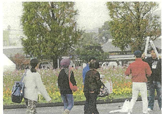
志摩中央公園おもてなし会場の花壇。 来場者のフォトスポットにもなっています。