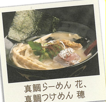
真鯛らーめん 花、 真鯛つけめん 穂

12 太陽の血 ☎糸島市泊844-1 ☎092-332-8557 ☎6:30～9:00 11:00～14:00 17:30～20:30 休 なし