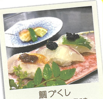
鯛づくし ※写真はコース料理の一例です

20 焼とり 雲海 ☎糸島市前原西1-8-23 ☎092-323-6133 ☎17:30～ 休 月曜日