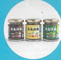
糸島調味噌香る三姉妹 〈JF糸島〉