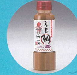
糸島鯛液みそ 〈糸島食品〉