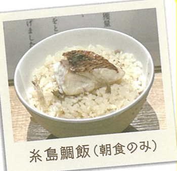
糸島鯛飯(朝食のみ)

11 伊都ダイニング 元気くらぶ伊都 ☎糸島市泊765 ☎092-331-1000 ☎10:00～23:00 休 第2・第3・第4水曜日