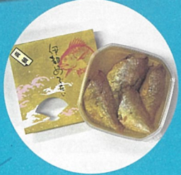
鯛のオリーブ漬け 伊都めでたい 〈福吉水産〉