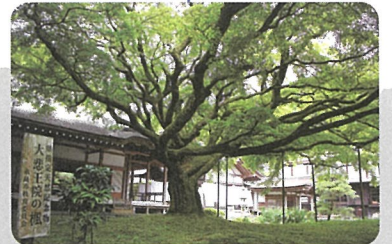
雷山千如寺大悲王院