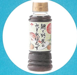
鯛と野菜のみぞれポン酢 〈株式会社やますえ〉