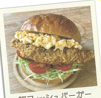
鯛フィッシュバーガー ※土・日曜日のみ販売

21 味楽寿司 ☎糸島市加布里1-4-20 ☎092-322-2238 ☎11:30～14:00 17:00～21:00 休 月曜日・第1火曜日