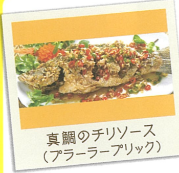
真鯛のチリソース (アララーアプリック)

23 itofull お寿司で作った海鮮パフェ (イトフル) ☎糸島市加布里5-25-5 ☎092-332-0076 ☎11:30～15:00 休 火曜日・水曜日