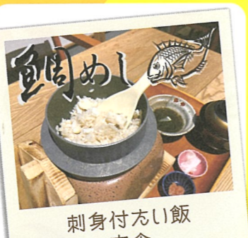
刺身付たい飯 定食

おもと 4 大門茶屋いろり ☎糸島市志摩芥屋741-1 糸島ピクニックヴィレッジ内 ☎080-8377-7420 ☎11:00～ 休 水曜日