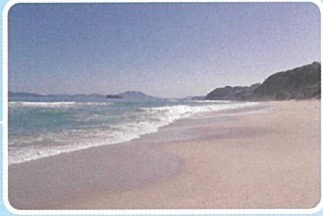
二丈鹿家 姉子の浜