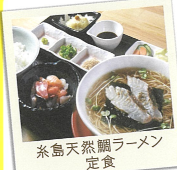
糸島天然鯛ラーメン 定食

14 ハーブガーデン プティール倶楽部 伊都国 ☎糸島市浦志366-2 ☎092-331-2220 ☎11:30～15:30 17:00～21:00(土日のみ) 休 水曜日