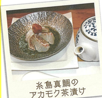
糸島真鯛の アカモク茶漬

15 相鮮魚商店 ☎糸島市前原中央2-5-18 ☎092-321-2908 ☎11:00～15:30 17:00～22:00 休 水曜日