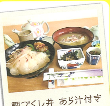
鯛づくし丼 あら汁付き

5 磯の屋はなれ ☎糸島市志摩芥屋748-1 ☎092-332-2036 ☎11:00～16:00 休 不定