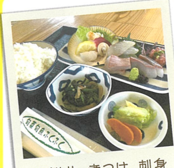
海鮮丼、煮つけ、刺身

24 タイ料理ドワンチャン ☎糸島市二丈深江 2129-18 ☎092-325-3986 ☎11:00～15:00 17:00～21:00 休 水曜日(不定)