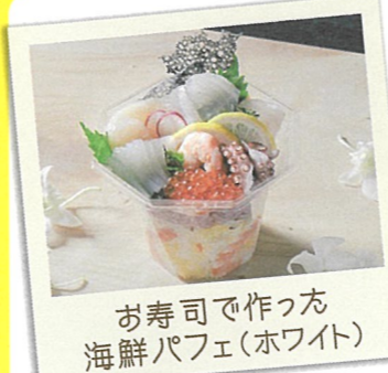
お寿司で作った 海鮮パフェ(ホワイト)

22 コウメバーカリー ☎糸島市加布里1-11-1 ☎092-329-0150 ☎8:00～ 休 火曜日