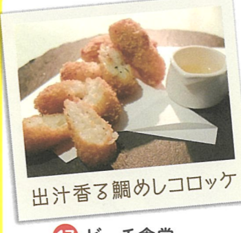
出汁香る鯛めしコロケ

16 旨海寿 ☎糸島市前原駅南3-19-39 ☎092-330-7330 ☎11:30～14:00 17:30～21:30 休 月曜日・火曜日