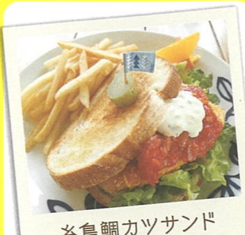
糸島鯛カツサンド

6 地魚料理の店 なぎさ ☎糸島市志摩芥屋865 ☎092-328-2047 ☎11:30～ 休 不定