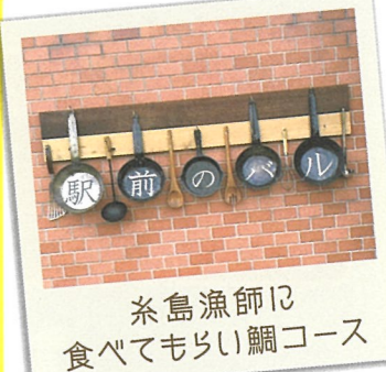
糸島漁師に 食べてもらい鯛コース

17 ビーチ食堂 Mr.Beach ☎糸島市前原中央2-1-21 駅前ビル2F ☎092-321-4925 ☎11:30～15:00 17:00～23:00 休 火曜日