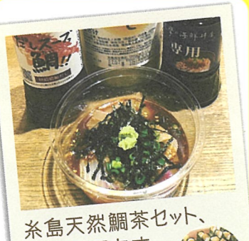
糸島天然鯛茶セット、 糸島鯛天むす

18 駅前のバル ☎糸島市前原中央 2-1-21駅前ビル1F ☎092-324-1022 ☎18:00～22:30 休 日曜日・月曜日・火曜日・水曜日