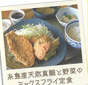
糸島産天然真鯛と野菜の ミックスフライ定食

10 志摩の海鮮丼屋 ☎糸島市志摩津和崎33-1 志摩の四季内 ☎092-327-4033 ☎11:00～14:30 休 水曜日