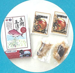
真鯛茶漬け 〈株式会社やますえ〉