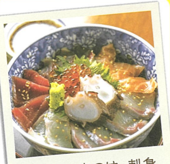
海鮮丼、煮つけ、刺身

19 駅前の魚屋さん ☎糸島市前原中央 2-1-1 ☎070-3983-4384 ☎16:00～18:00 休 月曜日・火曜日・水曜日・木曜日