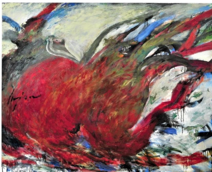
「みんなウソ」2020年制作/100号

船越のアトリエで使用されていた貴重な筆、絵具、パレット、土台、サイドテーブルなど、遺品を多数展示。野見山氏が作画に没頭された空間を再現します。