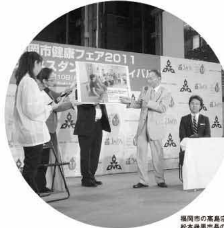
福岡市の高島宗一郎市長と松本徹男市長の「健康トークショー」の様子(2011年10月)

有酸素運動で、効果的にメタボリックシンドローム(内臓脂肪症候群)を予防しましょう!