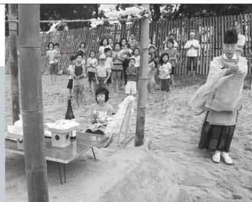
砂で作った祭壇の前で「1年間みんなが無事でありますように」と祈願

当日は早朝から大竹を立て、海岸の砂で祭壇を作り、祭事が行われ、祭事が終わると大竹を海に流し、水泳が解禁になりました。