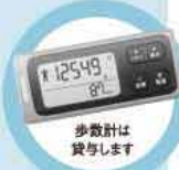
歩数計は貸与します

競技スタート 歩数競技は指定(貸与)の歩数計がお手元に届いてから随時スタートしてください。