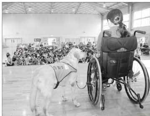
「犬のように、すべての人に思いやりを」とのメッセージが伝えられました