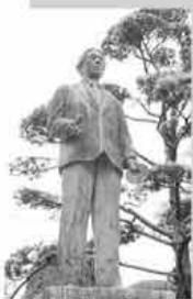
作品/原田大六氏立像

原田新八郎氏の作品は、私たちの身近な場所でも目にすることができます。伊都郷土美術館前の「母子像」はもちろん彼の作品。伊都文化会館大ホールの縦横「天地創造」、糸島農業協同組合本店前庭にある「土を踏み人」、伊都歴史博物館旧館前庭の「原田大六氏立像」、志摩姫島にある「野村望東尼胸像」などはその一例です。