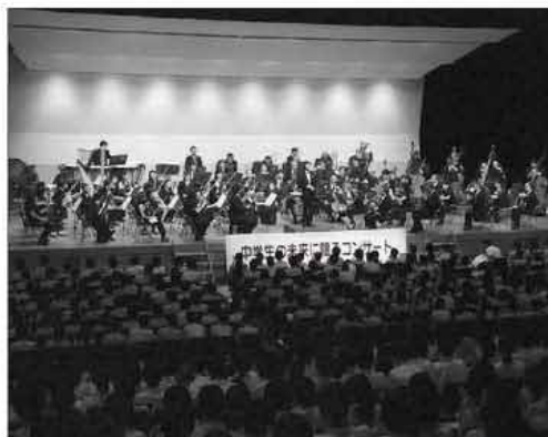
70人からなるフルオーケストラによる演奏は迫力があり、感動的

この日は前原西中学校の全校生徒を前に、モーツァルトやベートーベン作曲の有名な曲が70人のフルオーケストラで生演奏されました。