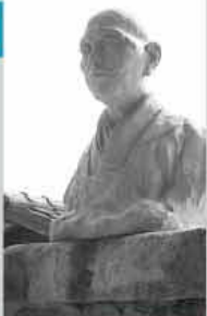
作品/野村望東尼胸像