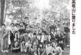
高祖山に登りました

6月9日・10日、今宿野外活動センターで第1回講座「開講式&高祖山登山」を実施。小学4年生から6年生までの31人が参加しました。 1日目は、危険予知トレーニングや規律訓練、野外炊飯など一年間の活動の基本を学び、2日目の高祖山登山では、天候にも恵まれ全員で切り切ることができました。 最初は緊張した様子の子どもたちでしたが、すぐに打ち解け、元気がいっぱい楽しんでいました。