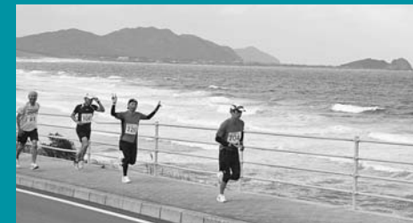
幣(にぎ)の浜沿岸を走るランナー。右奥は芥屋の大門

糸島の風を感じながら、海・山を走り抜ける「糸島観にマラソン」。標高231mの彦山越えといった想像以上のハードコースも、眼下には玄界灘の絶景の大パノラマが広がり、参加者は「糸島観にマラソン」の醍醐味(だいがみ)を存分に味わいました。また、各エイドでの給水スタッフによる心のこもったもてなしが、疲れた参加者を大いに癒やしていました。