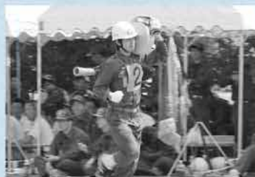
火災現場を意識して、ポンプ・ホースを操作する上での正確さ、機敏さを競う操法大会

きではないだろうか。市や行政区には、地域全体で消防団を支える体制づくりを考えてほしい」とも訴える。 東日本大震災以降、地域防災の重要性が改めて見直されており、そのコミュニティの核となるのが消防団である。防災活動以外にも、夜警や地域の祭りへの協力など、消防団はさまざまな形で地域活動を支えている。こうした活動を将来にわたり持続させるためには、消防団員の地道な活動に対する社会全体や市民一人ひとりの理解と協力が不可欠だ。