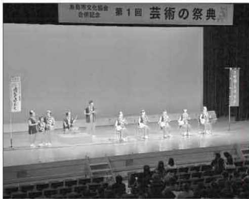
写真は20日に行われた三味線・民謡の様子

山頂では糸島半島を一望する絶景に大感激。下山した子どもたちは、充実感と達成感にあふれ、また山に登りたいと語っていました。