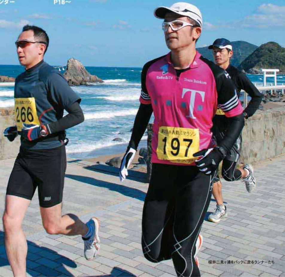
桜井二見ヶ浦をバックに走るランナーたち