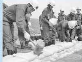
梅雨期の大雨に備えて行われる土のう積みなど、実践ながらの水防訓練

周りの理解によりある程度の融通は利く。しかし平日昼間に出勤できるのは自営業者ら数人に限られるのが現状。また「以前は対象者の名簿を基に勧誘を行っていたが、最近個人情報保護の観点から、それができなくなった。少子高齢化が急速に進む現在、団員の確保は非常に困難」と活動の難しさを語る。 「消防団では飲酒を強要されるイメージを持たれることがあるが、最近ではそのようなことはない。活動を通じて、一回りも年の離れた先輩・後輩と知り合い、人間関係の幅が広がっている。地元を守るという意味で、本来なら20歳になれば誰もが入団すべ