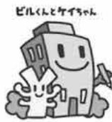
経済センサスキャラクター

これまで実施していた事業所の調査(事業所・企業統計調査や商業統計調査など)を廃止もしくは中止し、経済センサスに統合。これにより、調査の精度は維持しながら、調査票などへの記入の負担を軽減しています。