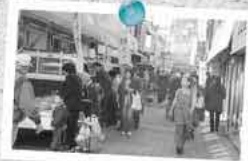
唐津街道前原宿 軽トラ市