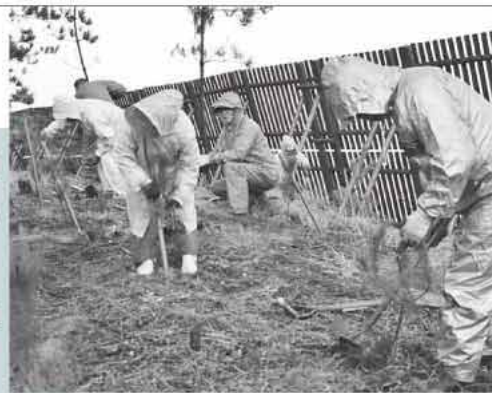
20年ほどで成長する松。地域で守り育てていきます

緑の募金助成事業を活用して行われた今回の植樹。予定されていた「植樹祭」は雨天のため中止になりましたが、地元有志24人と市職員が雨合羽を着て参加し、高さ約1mの苗を1本1本丁寧に植え付けました。