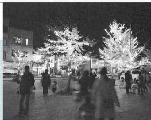
幻想的なイルミネーションを見て子どもたちは大はしゃぎ

会場では、来場者を温かく迎えようとぜんざいの無料配布なども行われ、友人や家族と記念写真を撮る姿も見受けられました。