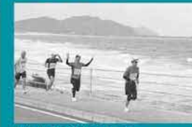
帯(にぎ)の浜沿岸を走るランナー。右奥は芥原の大門

糸島の風を感じながら、海・山を走り抜ける「糸島観にマラソン」。標高231mの彦山越えといった想像以上のハードコースも、眼下には玄界灘の絶景の大パノラマが広がり、参加者は「糸島観にマラソン」の醍醐味(だいがみ)を存分に味わいました。また、各エイトでの給水スタッフによる心のこもったもてなしが、疲れた参加者を大いに癒やしていました。