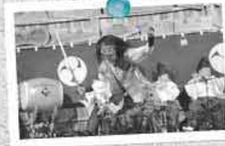
福井神楽(年越しの夜神楽)