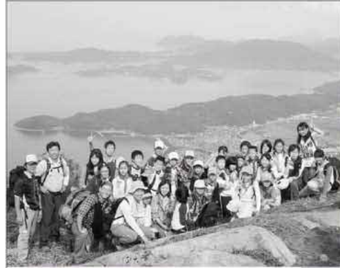
二丈岳を制覇し達成感にあふれる子どもたち