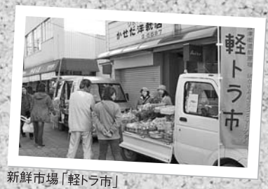
新鮮市場「軽トラ市」