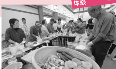
体験 昨年の漬物作り体験の様子

11月5日(土)・6日(日) 会場 フォームパーク伊都国 ☎(322)7661 ※毎週月曜日は休館日 (月曜日が祝日のときは翌日が休館日)