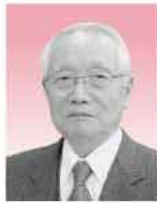
選挙管理委員会委員