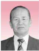
可也ジュニアロイヤルズスポーツ少年団指導者