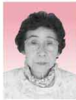
母子寡婦等福祉会役員