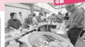
昨年の漬物作り体験の様子

11月5日(土)・6日(日) 糸島ファームパーク伊都国 ☎(322)7661 ※毎週月曜日は休館日 (月曜日が祝日のときは翌日が休館日)