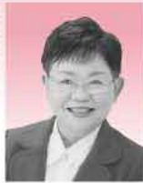
二丈町・糸島市議会議員