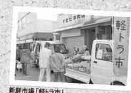
新鮮市場「軽トラ市」

『なんでも糸島 収穫祭』~いただきます! 糸島~実りの秋。糸島の恵みを実感しよう!