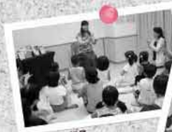
おはなし会の様子