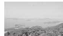
極楽展望台から糸島市を望む

市では、めざますまちづくりの理念や目標を広く市内外にアピールしていくために、糸島市の新たな決意として、4つの都市宣言を行いました。