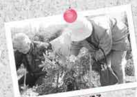
「なんでも糸島 収穫祭」の様子