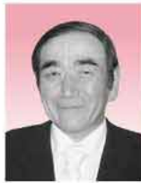
民生委員児童委員