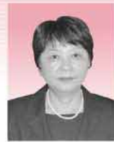
地 (神在四) 湖上 静江さん