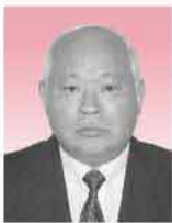
波多江校区体育委員