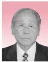
糸島漁業協同組合福吉地区代表理事