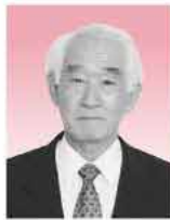
固定資産評価審査委員会委員