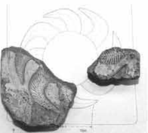
那珂遺跡(福岡市博多区)で出土した巴形銅器の鋳型。奴国と伊都国との関係を知る上で、興味深い資料として注目される

形が一致したのです。このことから、奴国で作られた巴形銅器が直線距離で約400km離れた瀬戸内海沿岸地域まで運ばれたことが分かりました。このように鋳型と製品が一致する例は極めてまれで、貴重な発見といえます。 伊都国と奴国の交流 巴形銅器の中には、伊都国と奴国の交流を示すものもあります。一昨年、奴国域にある那珂遺跡から出土した鋳型が伊都国王の墓(井原鏡溝王墓)から出土した製品