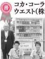
まちづくり支援自動販売機寄付金を寄付