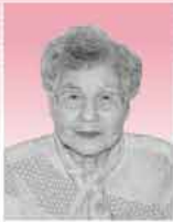
大正琴の琴春会を主宰