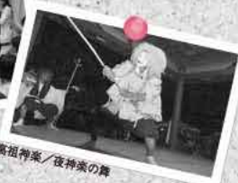
高沼神楽/夜神楽の舞