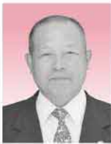
可也ジュニアロイヤルズスポーツ少年団指導者