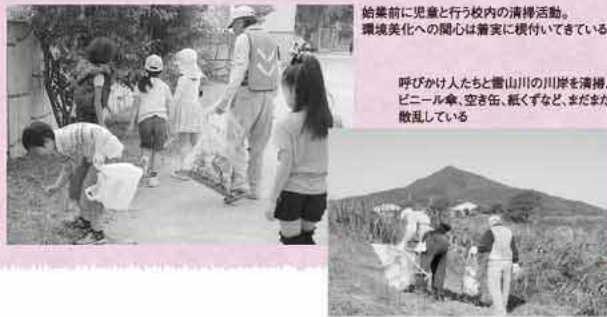
始業前に児童と行う校内の清掃活動。環境美化への関心は着実に根付いてきている