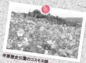
平原歴史公園のコスモス畑