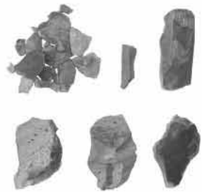
博多湾沿岸(築崎遺跡)から出土した碧玉

今から約1800年前の弥生時代、北部九州にあった国々は伊都国、糸島市と福岡市西区の一部と奴国(春日市、福岡市周辺)を中心として、国内外との積極的な交流を 見どころ紹介 『北部九州の国々と他地域との交流』 山陰地方との交流 平成15年、市内において、山陰地方との深い交流を物語る発掘成果がありました。潤地頭給遺跡(東風小学校敷地内)の発見です。遺跡からは出雲の花仙山(島根県松江市)で採れた緑色の美しい石「碧玉」を加工して管玉などのアクセサリーを作る玉作工房が数多く見つかりました。また、碧玉と一緒に、山陰地方で作られた土器なども出土しており、潤地頭給遺跡でアクセサリーを作るために、原石である碧玉とともに加