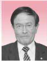
選挙管理委員会委員