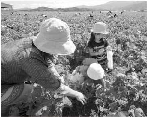
大きな枝豆を探そうと、必死に葉をかき分ける子どもたち

今年は、猛暑や突然の大雨などの影響で実りが悪かったものの、自分たちで採った枝豆をおいしそうに食べていました。