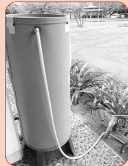
可也公民館に設置されている雨水タンク

雨水は「天水」とも呼ばれ、だれもが簡単に利用できる水資源です。あなたの家庭にも、雨水タンクを設置して、雨水を利用しませんか。