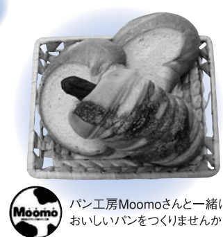
パン工房Moomoさんと一緒においしいパンをつくりませんか

これは、ワーク・ライフ・バランスの実現に向け、「仕事と生活の調和推進室」が行っているキャンペーンで、老若男女誰もが、仕事や家庭生活、自己啓発など、さまざまな活動について、自ら希望するバランスで展開できる社会をめざしています。 労働時間の短縮など働き方を見直し、家事や育児、地域社会に参画することで、一人ひとりが豊かな人生を送るにつながります。