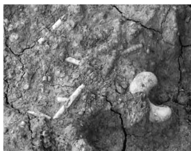
出土した装身具(徳永B遺跡)

遺跡の宝庫である糸島市周辺で行われた発掘調査の結果を速報し、併せて今年度新たに市指定文化財となった久米遺跡出土銅剣・銅戈、装身具、甕棺などを紹介します。 市内の調査速報 三雲・井原地区では、王都や王墓の内容を探る調査と、県道の拡幅に伴う調査が並行して行われ、古墳時代の住居跡や中世の土器を大量