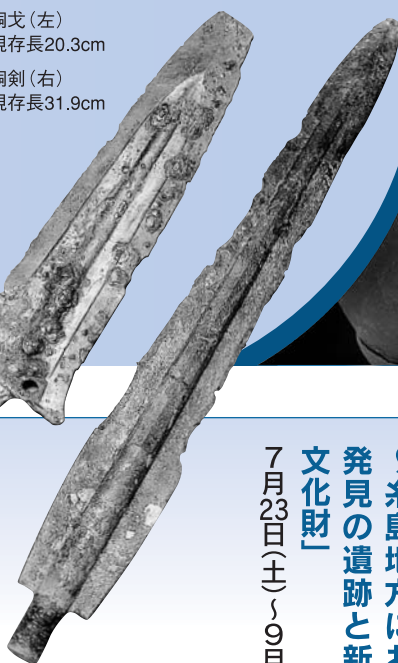
銅戈(左) 現存長20.3cm 銅剣(右) 現存長31.9cm

武器・装身具など甕棺墓に供えられたさまざまな副葬品。二千年の時を超え、まるでタイムカプセルのように当時の人々の生きた証を今に伝えています。