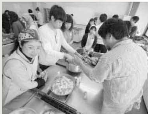
5カ国12種類の料理が、糸島の食材を使って作られました

シリアやモロッコなどの留学生が、糸島の食材を使ってお国の料理を披露。参加者は、お互いの国や地域のことを語り合いました。