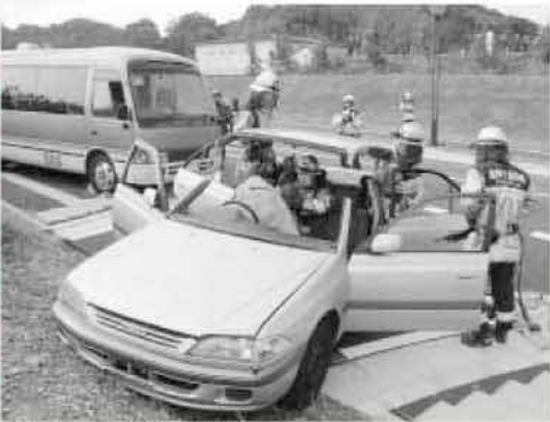
油圧カッターで車両を切断し、乗員を救出

火災発生時の連絡を受け、両市は互いに連携しながら、消火とレスキュー作業をてきぱきと進め、山林に向け放水を行いました。