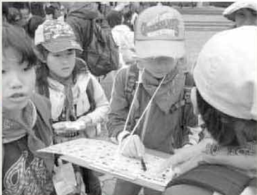
クイズに挑戦する中で、糸島に関する新しい発見もありました

各チェックポイントではクイズやゲームに挑戦。糸島市にちなんだ問題もあり、楽しく歩き、仲間とふれあい、ちよっぴりふるさとを再発見した一日となりました。