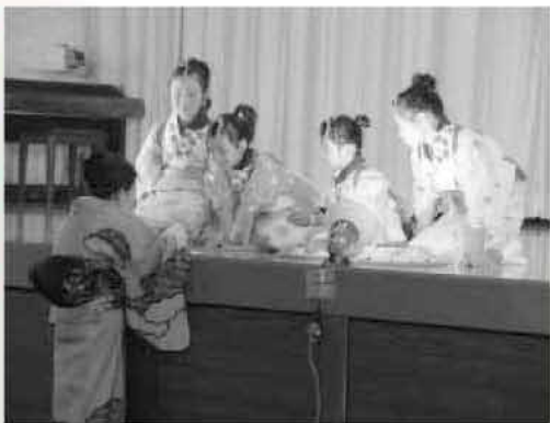
子どもたちのかわいい演技に「おひねり」も飛び出しました

ステージでは、子どもからお年寄りまで、多くの市民が歌や踊りを披露。会場からは声援が飛びます。子どもの出演には「おひねり」も出て、楽しさあふれる1日となりました。