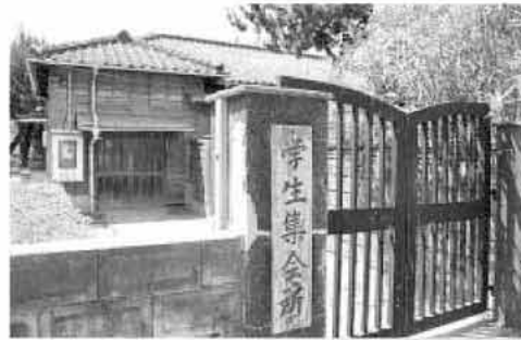
多くの九大生が利用した六本松キャンパスの「亭々舎」

かつて九州大学六本松キャンパスにあった、学生集会所「亭々舎(ていしや)」。現在、この亭々舎を伊都キャンパスへ復活させようという活動が行われています。