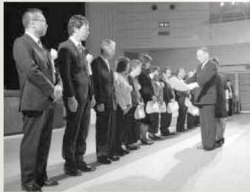
市長から表彰状が手渡されると、会場は拍手で包まれました

式典には、来賓や関係者など多くの人たちが出席。表彰されるみなさんに敬意を表し、万雷の拍手でたたえていました。