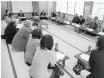
住みよい糸島市に向け意見や提言が出される

開催(開催日時)は、打ち合わせにより設定させていただきます。 会場 原則として、申し込み団体でお願いします。 懇談時間 2時間以内です。 進行 申し込み団体でお願いします。 申込方法 市役所情報政策課および二丈庁舎・志摩庁舎に備え付けの申込書に記入し、お申し込みください。電話やFAX、Eメールでも受け付けます。 申込条件 10人から20人程度の団体 ※要望や陳情を主たる目的にしたものは、受け付けませんので、ご注意ください。 申し込み問い合わせ 糸島市情報政策課 ☎(090)20090 FAX(090)20090 E-mail johoseisaku@city.itoshima.lg.jp http://www.city.itoshima.lg.jp