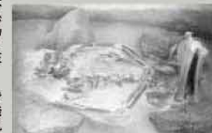
新町支石墓群で発見された人骨

その名が付けれられ、先史時代の朝鮮半島で盛行しました。 わが国で稲作が始まったころの支石墓は、糸島と佐賀・長崎県の西北九州一帯にしか分布しておらず、糸島では、新町支石墓群や志摩支石墓群など有名です。志摩新町にある「新町支石墓群」では、支石墓を含む57基の墳墓が見つかり、埋葬された人たちの骨なども残っていました。 発見された人骨 支石墓など朝鮮半島系