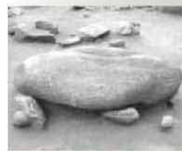
稲作開始期の支石墓は西北九州のみ分布

開催(開催日時)は、打ち合わせにより設定させていただきます。 会場 原則として、申し込み団体でお願いします。 懇談時間 2時間以内です。 進行 申し込み団体でお願いします。 申込方法 市役所情報政策課および二丈庁舎・志摩庁舎に備え付けの申込書に記入し、お申し込みください。電話やFAX、Eメールでも受け付けます。 申込条件 10人から20人程度の団体 ※要望や陳情を主たる目的にしたものは、受け付けませんので、ご注意ください。 申し込み問い合わせ 糸島市情報政策課 ☎(090)20090 FAX(090)20090 E-mail johoseisaku@city.itoshima.lg.jp http://www.city.itoshima.lg.jp