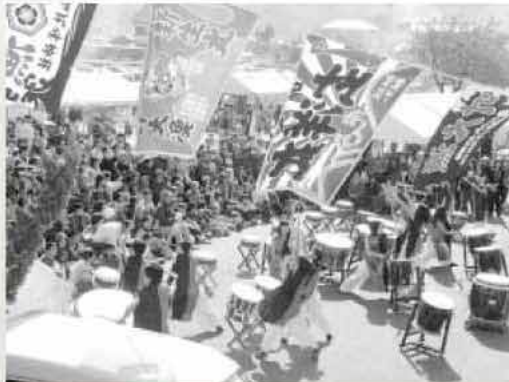
二丈絆太鼓の演奏が祭りを盛り上げました

広場には、新鮮な魚介類や野菜、花、植木などのほか、焼き鳥なども販売され、大勢の人が二丈の秋の味覚を楽しんでいました。