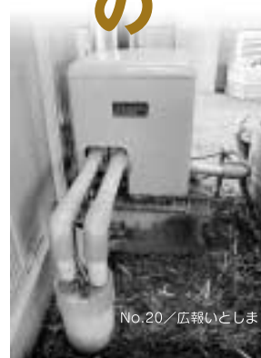
井戸を掘ったら検査しよう

問い合わせ 糸島市生活環境課 ☎(332)2068 福岡県筑紫保健福祉環境事務所 ☎(513)5612