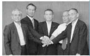
関係者の協力で協定書の調印が実現しました

9月8日、雷山校区区長会と波多江行政区、波多江中町隣組の各自治会組織と九州電力株式会社・糸島市の間で「環境保全協定書」を締結しました。 電力の確保は、将来の市の発展や市民生活の向上に必要な不可欠です。しかし、施設の設置による景観などに与える影響などについて、市民のみなさんから不安や疑問の声がありました。市はこれを解消するため、昨年10月に九州電力に「4項目の申し入れ」を実施。九州電力から「平野部での送電線の地中化」と「変電所のコンパクト化と緑化」「安全確保」など異例ともいえる踏み込んだ回答を受けました。 今回、関係者の協力で「環境保全協定書」を締結することになり、市民生活や市の発展に必要な電力の確保、市の魅力である自然環境の保全の両方をかなえることができました。