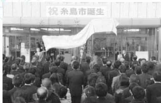
地域や行政の発展に貢献された人たちの尽力で、今年の1月1日に前原市と二丈町、志摩町が一つになり、糸島市が誕生した