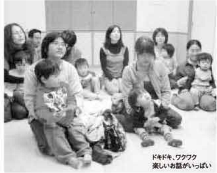
ドキドキ、ワクワク 楽しいお話がいっぱい