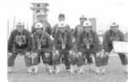
準優勝を記念して撮影