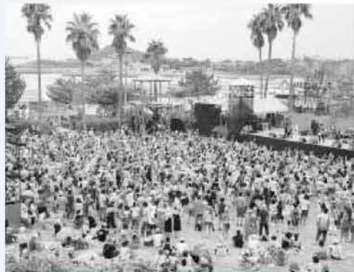
芥屋が若者と音楽で埋め尽くされたサンセットライブ2010の様子

会場には、メインステージのほか複数のステージが設けられ、海を楽しんだり音楽やトークを楽しむ若者であふれ返りました。