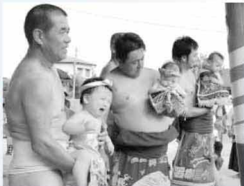
力士に抱えられ、初土俵をお披露目する化粧まわしを戴いた男の子たち

初めての土俵に、大声で泣く子も多く、会場は笑いでいっぱい。わが子の初土俵をカメラに収めようと大にぎわいとなりました。