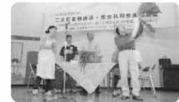
講座のテーマを劇で分かりやすく紹介