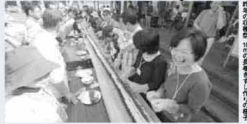
昨年の収穫祭、10mの長巻きずし作りの様子

いとしまの恵みを実感しよう ファームパーク伊都国では、11月6(土)・7日(日)に「なんでも糸島 収穫祭」を開催します。採れたて農産物の直売はもちろん、糸島の農力を体験できるさまざまな催しが盛りだくさん。みなさんお誘い合わせの上、お出でください。 ※メニューは変更する場合があります。 ※体験受付は、当日のみとさせていただきます。