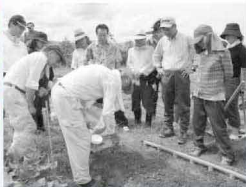
芽が出てすぐは、ダンゴムシに注意することなどを説明

その後、畑に移動して鋤を使って畝上げをした後、ダイコンの種まき。参加者は、種を植える幅や深さやまくときの注意、害虫のことなどを真剣に聞いていました。