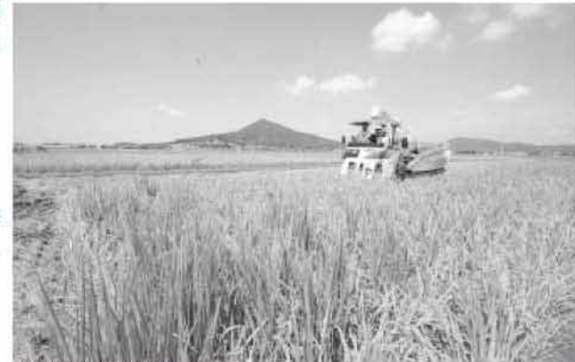
糸島の大きな魅力は恵まれた自然と、盛んな農業。農業委員をはじめ多くの人たちによって地域の農地と農業は守られている