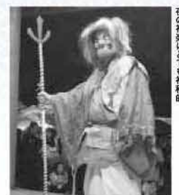
夜の神楽はとも神秘的

500年以上の伝統を誇るこの神楽は、現在は、高祖地区の神楽師などで組織する「高祖神楽保存会」によって、技芸の伝承と後継者の育成などを行いながら、たいせつに受け継がれています。