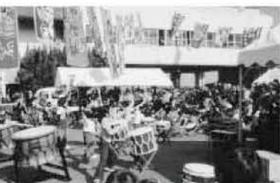
二丈幹太鼓による演奏(写真は一昨年)

いております。 ●お問い合わせ先 所在地 糸島市前原中央2丁目7-7(サンリブ前原店内) 営業時間 10時から20時まで ☎(0323)2654 お問い合わせ 糸島市農業振興課 ☎(0902)2087