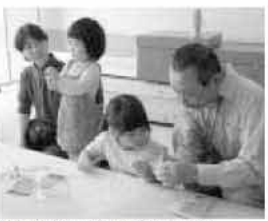
博物館ボランティアの指導で、勾玉づくり