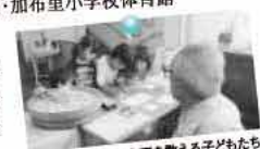
大豆を数える子どもたち