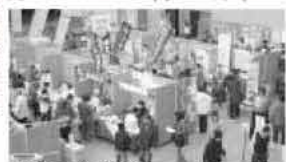
およそ50のブースが並び

商工会スタジアム 2010 市内3商工会青年・女性部が「商工会スタジアム2010」を開催します。 日時 10月31日(日)10時から17時まで 場所 可也公民館、志摩中央公園、福祉センター「ふれあい」 会場には、約50のブースが並び、商品展示をはじめ、お店のPRや説明のほか、みなさんからの相談にも気軽に応じます。 また、各種セミナーや市内の6年生が描く「働く人」絵画展、特産品が当たるアンケートなど楽しい企画がいっぱい。みなさんの来場をお待ちしています。 ※詳しくは「広報いとしま」10月1日号をご覧ください。 問い合わせ 前原市商工会 ☎(090)2679