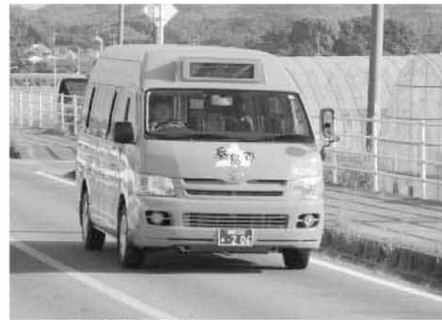
コミュニティバスなどは、地域のたいせつな交通手段 (志摩庁舎一本庁舎二文庁舎を結ぶ「庁舎線」)

積極的なバス利用をお願いします。 アンケートのご協力 ありがとうございます 市は、合併に伴い、市内の公共交通の再構築に向け「糸島市地域交通計画」を今年度策定します。 計画の基礎資料とするため、市民から無作為に2千名の方を抽出し「公共交通に関するアンケート」を実施しました。 多くのみなさんにご協力をいただき、ありがとうございました。いただいたご意見を今後の交通施策に生か