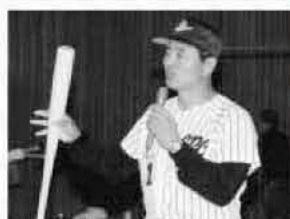
平成4年に市内で開催されたイベントの模様。王貞治さんも来賓。