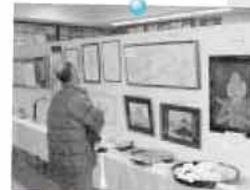
力作の展示もあります

会場 可也公民館・引津公民館・芥屋公民館・桜野公民館 内容 文化祭実施期間中、公民館受付でスタンプカードを配布しています。スタンプカードに各公民館のスタンプを押し、問題の解答を記入してください。4公民館のスタンプを集め、全問正解された人に地域の特産品などを賞品として差し上げます。