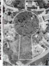
鏡子塚古墳前方後円墳の空中写真

外には、鉄製の太刀や剣、短刀や鉄などの武器が整然と並べられていました。 これらのうち、方格規矩四神鏡には金メッキが施されていました。これは国内でも僅かしか発見されていない珍しいものです。 平原王墓から約200年後の糸島で、これらの副葬品に囲まれて眠っていたこの墓の主は、いったいどんな人物だったのでしょうか？ 現在、銅鏡など出土品の大半は、京都大学総合博物館に収められています。