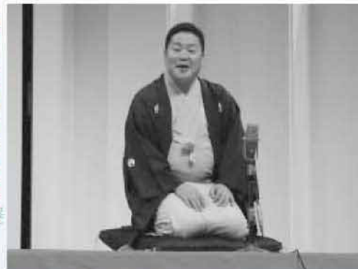
入院時のエピソードを交えながら救急医療のたいせつさを語る

また、救急医療ロボットについての講演や市消防本部救急隊による救命講習なども行われ、参加者は救急の重要性を実感しました。