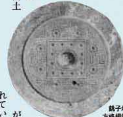
鏡子塚 前方後円墳 四神鏡

今回ご紹介するのは、国史跡の一貫山鏡子塚古墳です。 今からおよそ1600年前の4世紀後半に築かれたと推定されるこの古墳は、全長103メートルもある糸島地方最大の前方後円墳です。