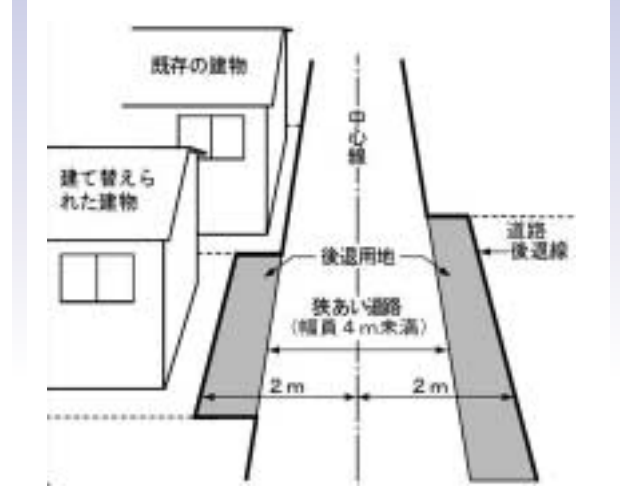
図① ■ セットバックのイメージ

狭あい道路とは 現況幅員4m未満の私道を除いた以下の道路 ● 建築基準法第42条第2項道路 ● 建築基準法第43条第1項ただし書き道路