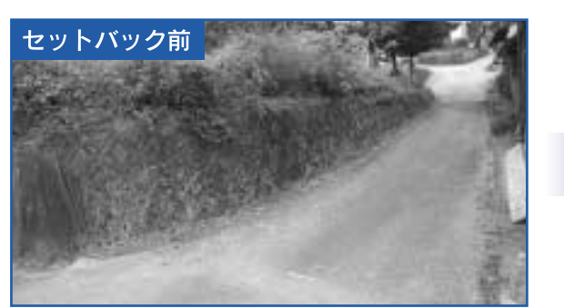
安全確保などのため、道路幅が4mになるようにセットバックした用地(写真の道路左側部分)を市が買い取るようになりました。

問い合わせ セットバックの相談・説明 糸島市都市計画課 ☎(332)2077 用途地域外 80000円/㎡ その他の用途地域内 120000円/㎡ 商業地域・近隣商業地域内 150000円/㎡ セットバック買い取り単価は、都市計画法の用途地域によつて、次のとおり3段階の設定をしています。