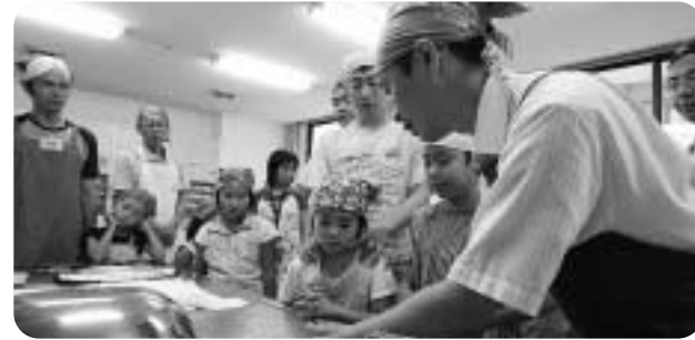
昨年の米粉を使ったパン作りクッキング