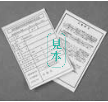
限度額適用認定証

国民健康保険 昨年(注6)の見直しにより、病院などで支払う一部負担金の割合(3割または2割(注6))を見直しました。新しい高齢受給者証は、7月下旬に被保険者に送付されます。 一部負担金の割合の判定方法は図2のとおりです。 ※注6 2割負担の人は、国の経過措置により、来年3月31日まで1割負担が継続されます。 対象者 国民健康保険に加入している70歳から74歳までの人 交付方法 7月下旬に世帯主あてに普通郵便で郵送 有効期限 平成23年3月31日