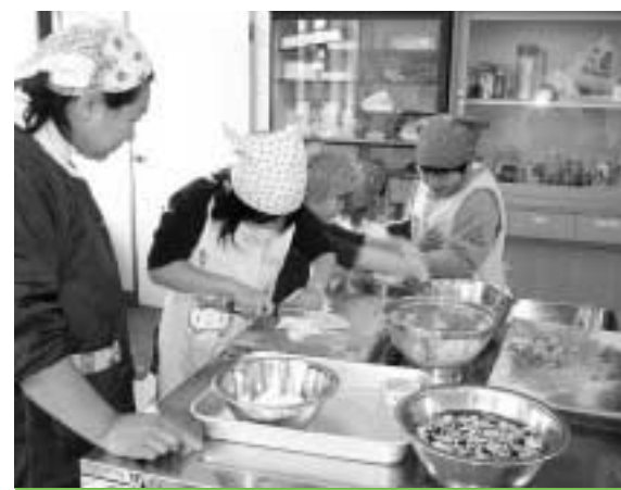
体験を通して、食と農を伝える

市内には「男女共同参画」と「食と農」の推進のため、3つの農業女性グループがあります。いずれのグループも県の女性農村アドバイザーやそのOG、JA糸島女性部各地域の部長など、農業を営む女性で構成され、さまざまな活動を行っています。