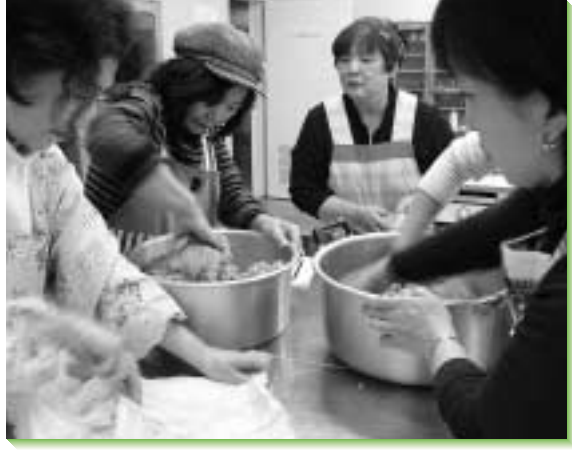
みそ造りなどで、食と農の活動を展開

● 農業女性の会 つばさ 次の時代を担う若年層などを対象に、地元野菜を使った簡単クッキングを開催するなど、いろいろなイベントで農