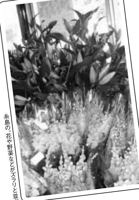
糸島の花や野菜などがスラリと並ぶ

可也山の南側のふもとにある小富士集落に「小富士物産直売所 愛菜」があります。朝どり新鮮がモットー