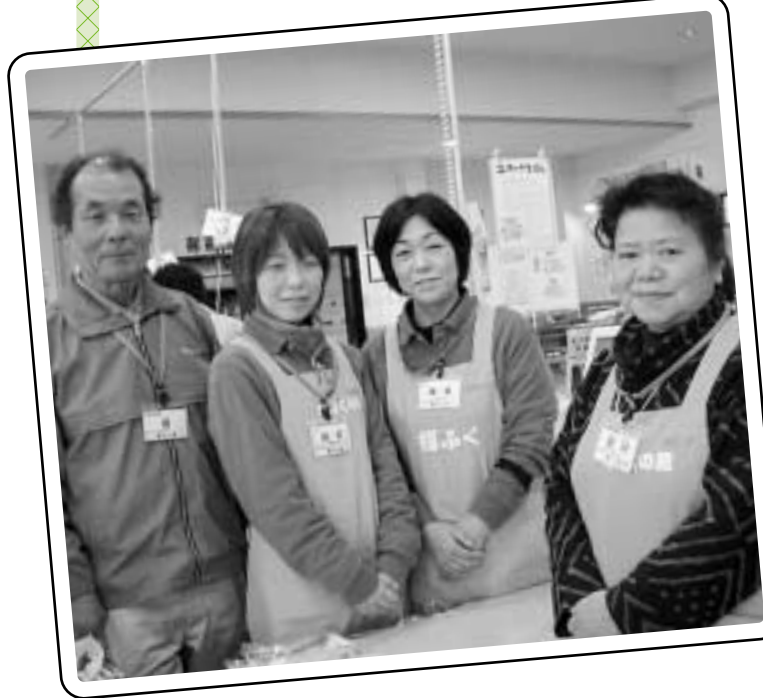
おいしい「ひなだんご」を振る舞います

日時 3月7日(日)9時30分から(予定) ※日時は変更する場合がありますので、お手数をかけますが、必ず確認の上お越しください。 連絡先 福ふくの里 ☎(326)6886