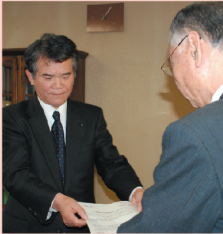
九州電力から回答書が提示されました

回答書は、旧前原市が申し入れた意向に沿ったものとなっています。回答書の主な内容は、次のとおりです。