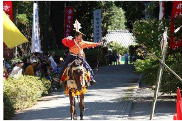
上 / 二見ヶ浦 下 / 桜井神社流鏝馬