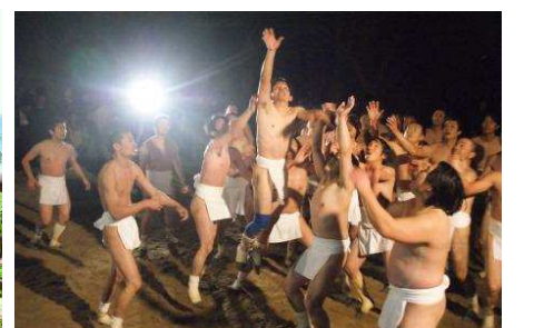
左 / サンセットロード沿いのレストラン 右 / 桜井神社餅押し