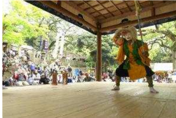
上/怡土の田園風景 下/高祖神楽