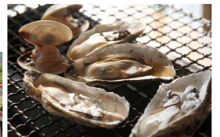
左/芥屋風止め相撲 右/糸島カキ