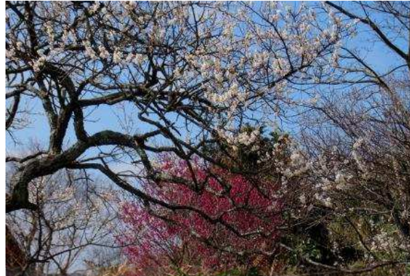
上/芥屋の大門 下/小富士梅林