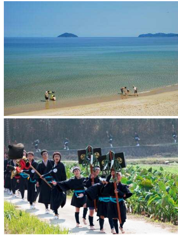
上/姉子の浜 下/福吉神幸祭