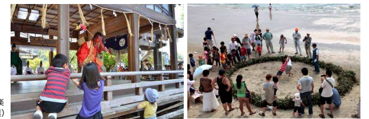
左/福井神楽 右/かずらの綱引き (子ども相撲)

◆ まむしの湯 福吉の日帰り入浴施設として地域に親しまれています。浴槽の種類も豊富で、日本庭園をイメージした露天風呂や檜風呂、家族でのんびりできる家族風呂などがあります。