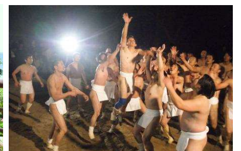
左 / サンセットロード沿いのレストラン 右 / 桜井神社餅押し