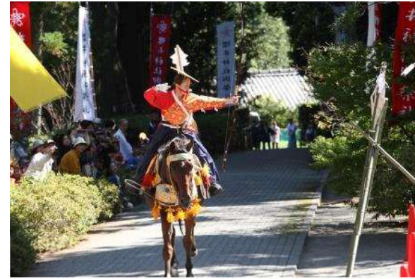
上 / 二見ヶ浦 下 / 桜井神社流鏝馬