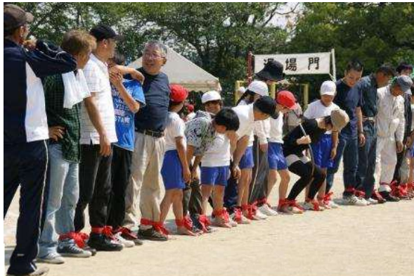
上/白糸の滝 下/地域合同運動会