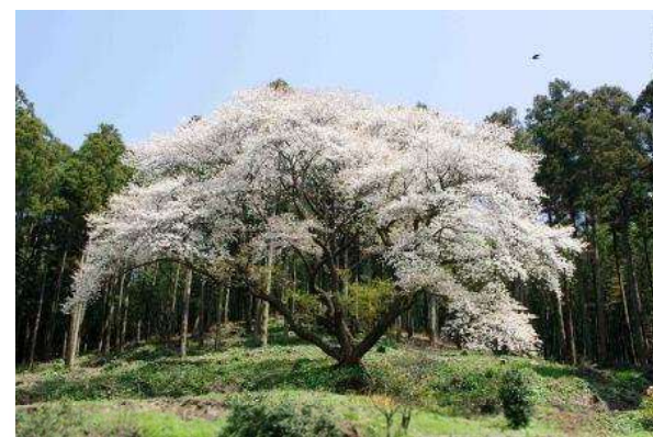
上/二丈の田園風景と電車 下/二丈松国大山桜