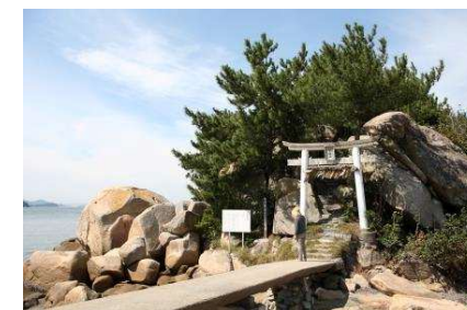
左/フォレストアドベンチャー 右/箱島神社