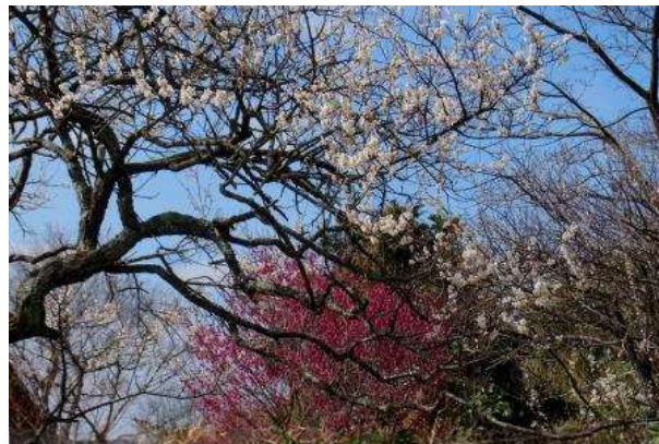
上/芥屋の大門 下/小富士梅林