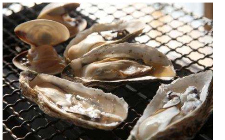
左/芥屋風止め相撲 右/糸島カキ