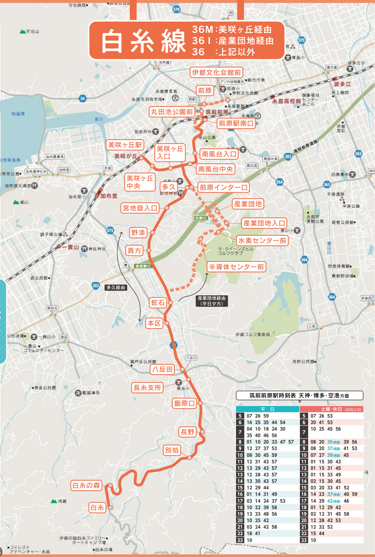
筑前前原駅時刻表 天神・博多・空港方面