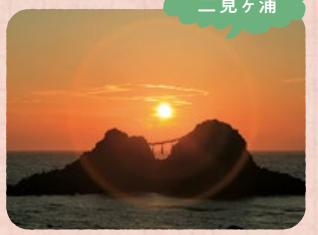
二見ヶ浦のシンボル「夫婦岩」に沈む夕陽

日本の渚百選・日本の夕陽百選に選ばれている絶景スポット「桜井二見ヶ浦」。中でも、夏至の頃に「夫婦岩」の間に沈む夕陽の神秘さは格別。毎年5月の大潮の干潮時に、「夫婦岩」にかかる長さ30メートル、重さ1トンの大注連縄(おおしめなわ)の掛け替えが行われる。