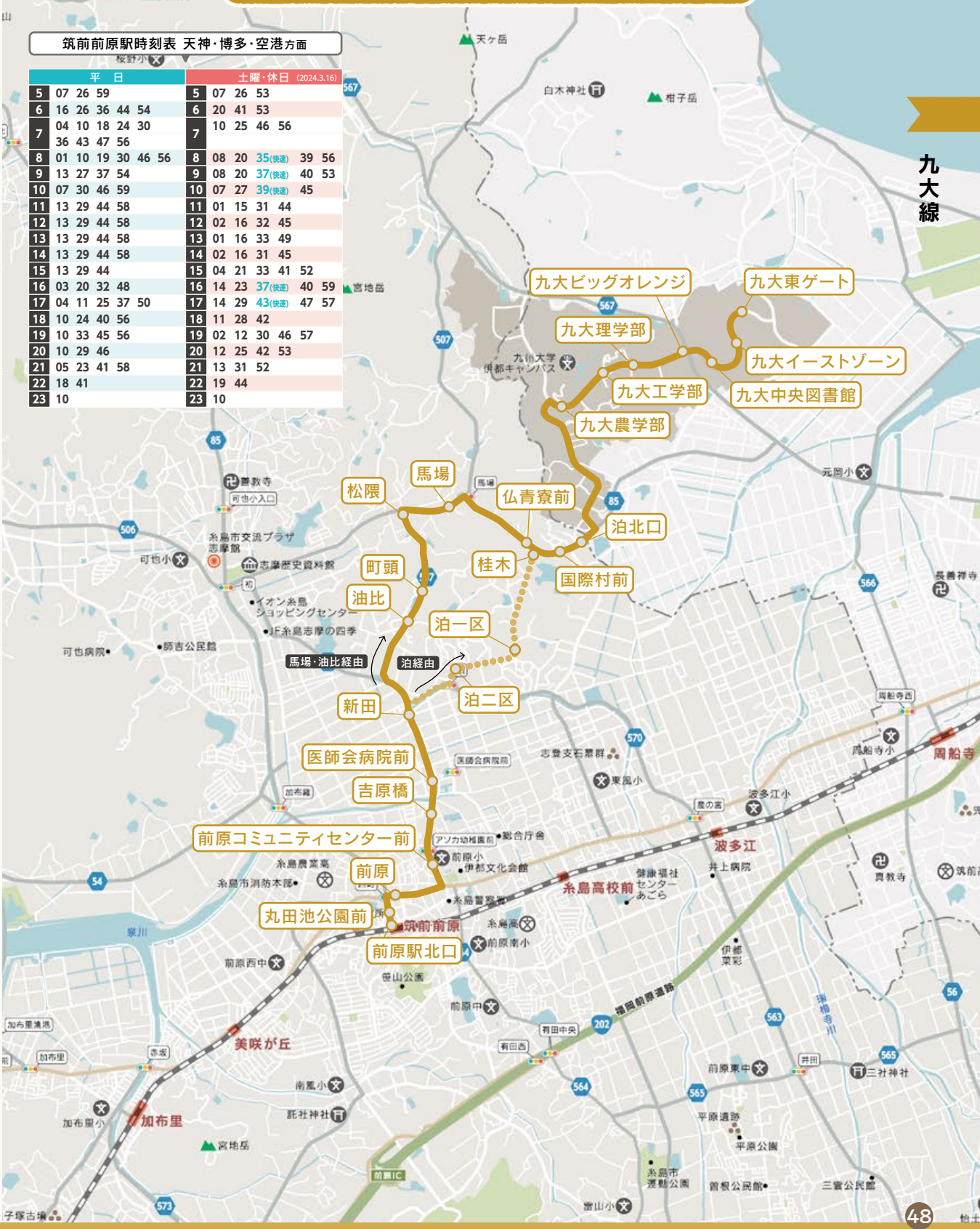
筑前前原駅時刻表 天神・博多・空港方面