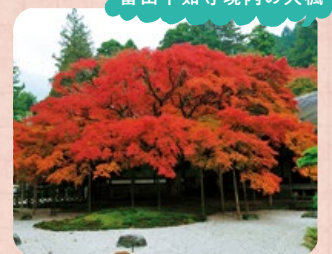
雷山千如寺境内の大楓

平日8時30分～17時の時間帯は『チヨイソコよかまちみらい号(予約制乗合バス)』の運行のみとなります。事前の会員登録と利用時に予約が必要です。詳しくはP5-6へ